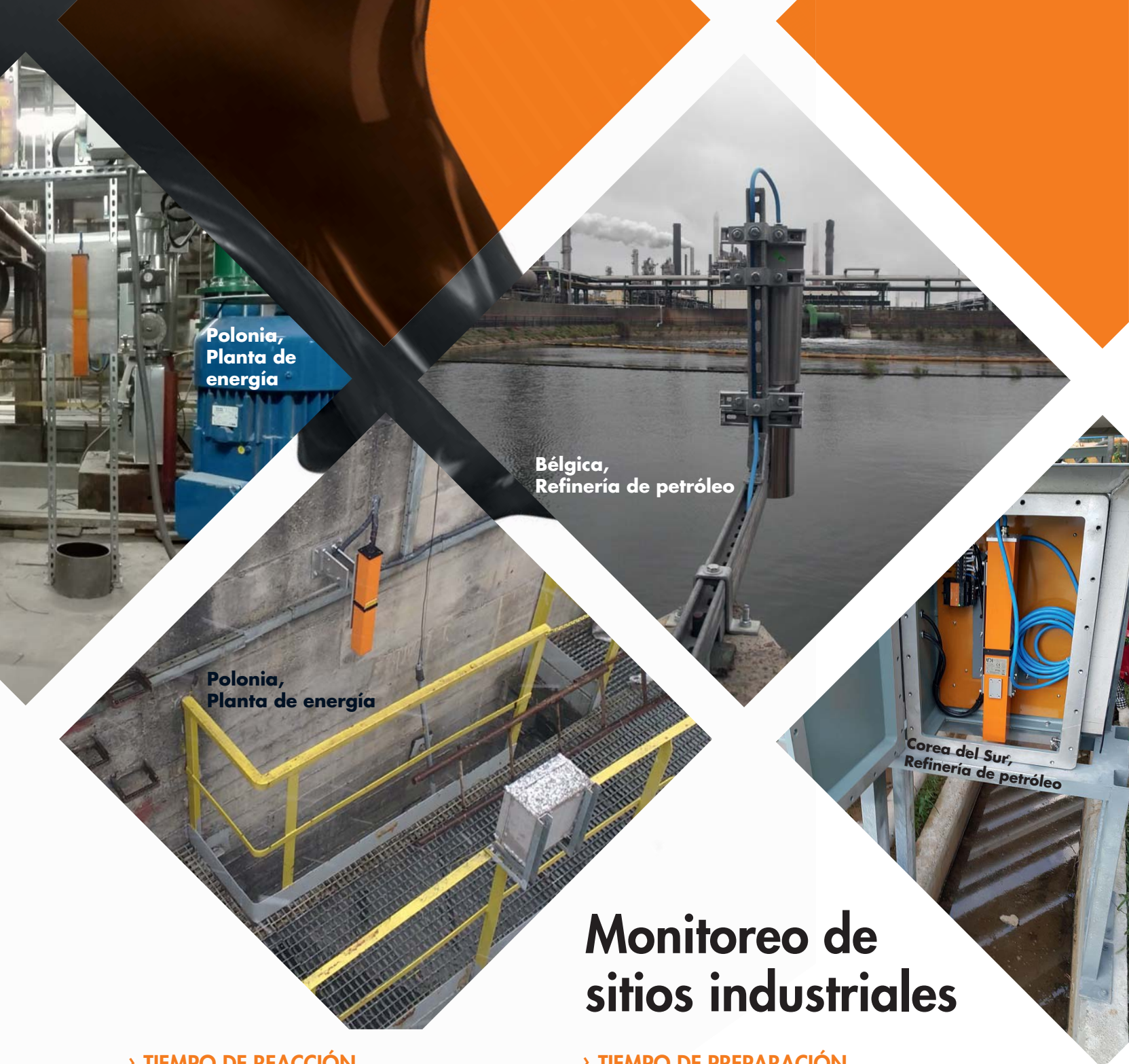
Polonia, Planta de energía