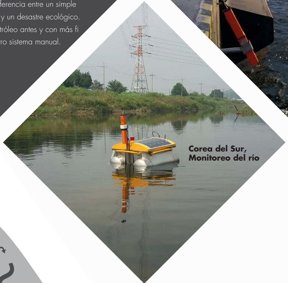
Corea del Sur, Monitoreo del río